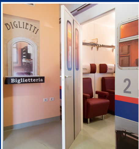
AMBULATORIO TNF a Gorle c/o Istituto Caprotti Zavaritt via Arno 14

INFO & ATTIVAZIONE SERVIZI 392.9441185 eventi@bergamosanita.it