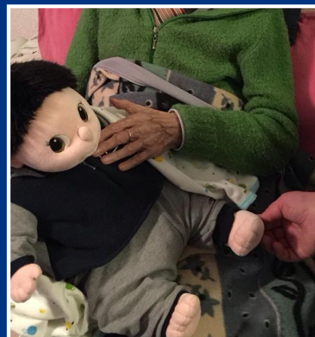
SERVIZI DOMICILIARI interventi a casa tua anche con il Voucher RSA Aperta